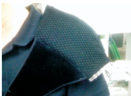
肩部冷熱膚帶固定帶 (醫療用)