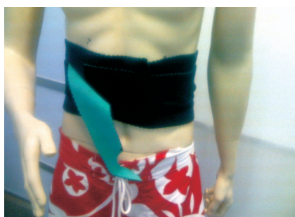
護腰環套 (休閒運動用)