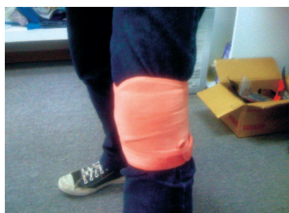
護膝帶 (休閒運動用)