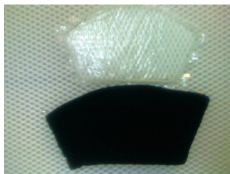
冷熱敷外套（休閒運動用）